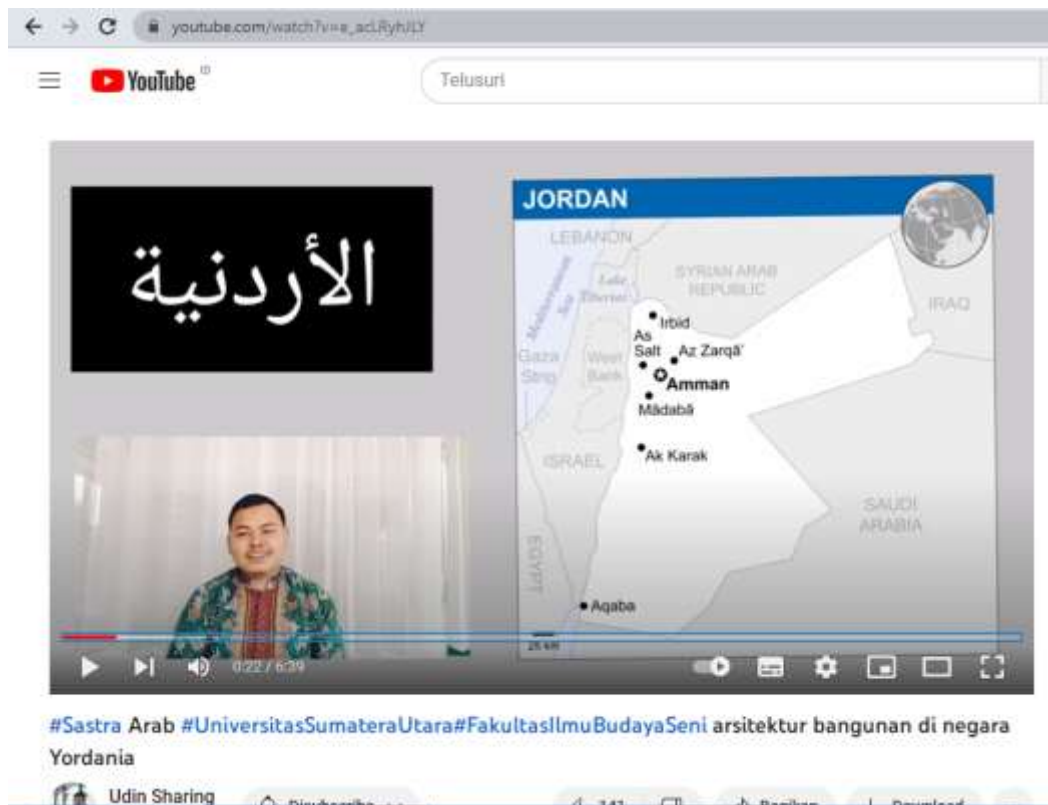
الصورة ٢. لقطة شاشة لمقاطع فيديو Youtube